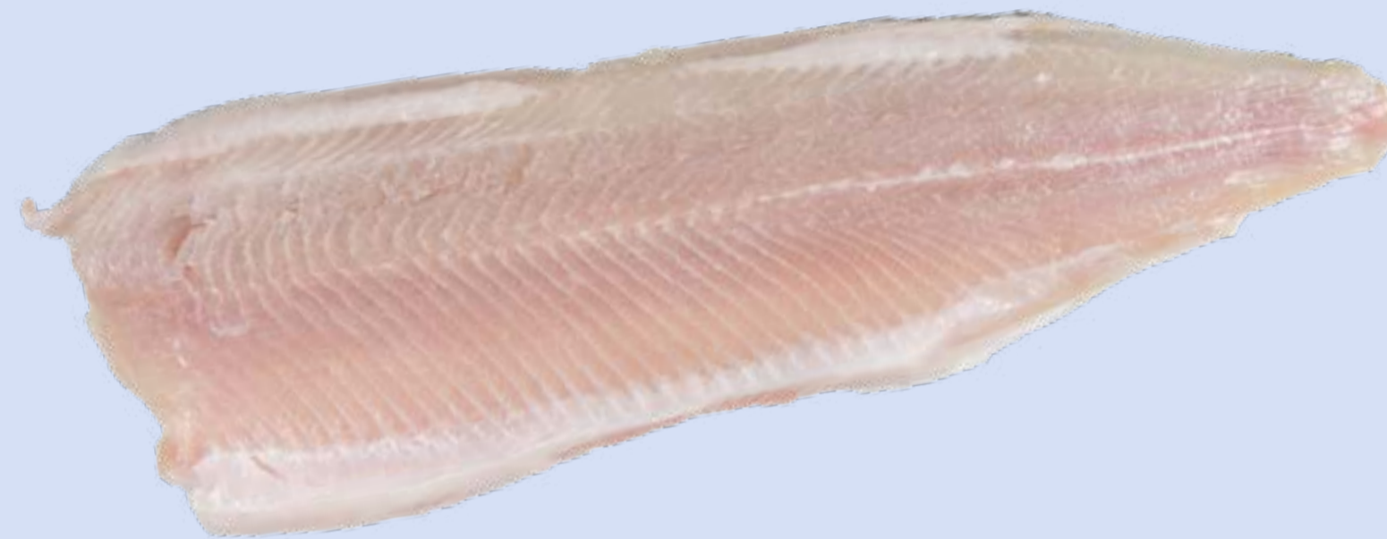
Benella Siikafilee, ruodittu

Suosimme tuotteissamme kotimaisia lajikannoiltaan elinvoimaisia järvikaloja ja vastuullisesti lähellä kasvatettua kalaa, erityisesti korkealaatuista Benella-kirjolohta ja -siikaa. Benella-kala nauttii puhtaasta, kotimaista ja sille optimoiduista aineksista valmistettua rehua. Siksi sen maku on aina aito ja raikas.