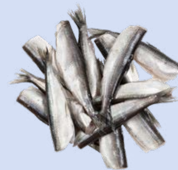
Kalavapriikki Muikku, perattu

Paino: n. 10 kg Tuotenumero: 6262 GTIN: 2371045400000