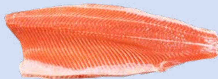
Benella Kirjolahifilee, C-leikattu

Paino: n. 3 kg Tuotenumero: 6244 GTIN: 2371045600004