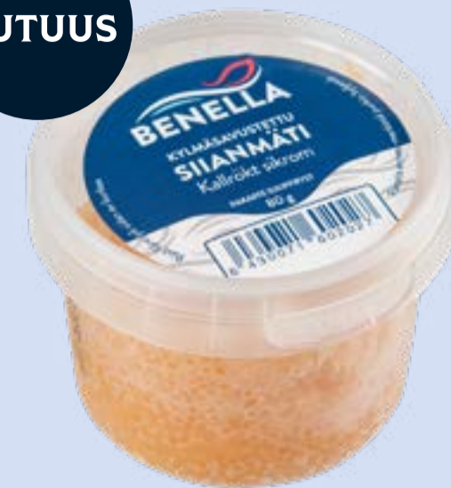
Benella Kylmäsavustettu, Siianmäti

Paino: 80 g Tuotenumero: 31502 GTIN: 6430071602027