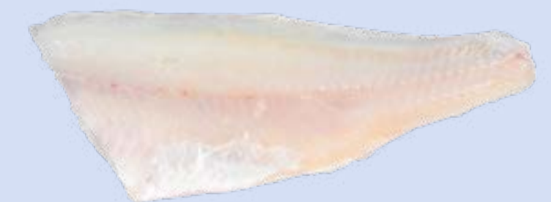
Kalavapriikki Kuhafilee, FI

Paino: 10 kg Tuotenumero: 51001 GTIN: 2371044600005