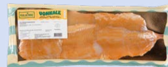
Kalaonni Kylmäsavusiikafilee, siivutettu

Paino: 150 g Tuotenumero: 51501 GTIN: 6430071600696